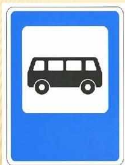
МЕСТО ОСТАНОВКИ АВТОБУСА (ИЛИ) ТРОЛЛЕЙБУСА